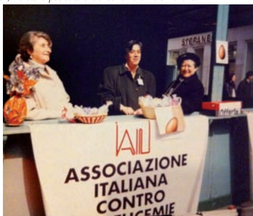
Banchetto con volontari. Si può notare il vecchio logo AIL.

Ogni gruppo ha autonomia nella gestione dei fondi raccolti dalle manifestazioni nazionali e locali; può accendere un conto corrente bancario sotto la responsabilità dei propri rappresentanti, fermo restando l'obbligo del rendiconto nei confronti del consiglio della Sezione provinciale, con il quale sono peraltro