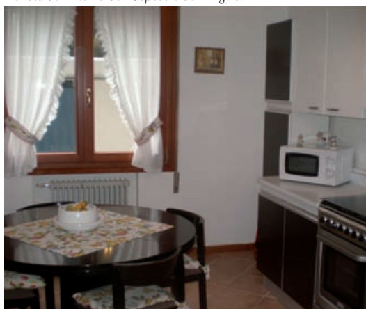
Uno degli ambienti di Casa All.

Un ingresso comune, con un grande armadio e la lavanderia che le due famiglie gestiscono. Per il resto i due appartamenti sono indipendenti e le famiglie possono restare in completa tranquillità privilegiando la propria privacy, che in certi momenti è la cosa più importante.