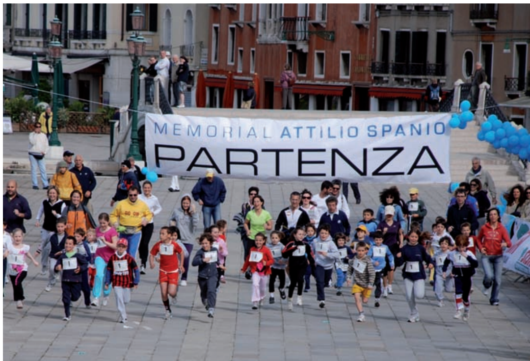
Piccoli e grandi partecipano all'ultima edizione del "Memorial Attilio Spanio", maratona podistica che si corre nelle vie di Venezia.

L'ospedale Civile "Umberto I" di Mestre nel 2003 e costato oltre 15 mila euro, o del sequenziatore ABI PRISM 7000 donato al dipartimento di Oncologia ed Ematologia Oncologica di Noale l'anno precedente.